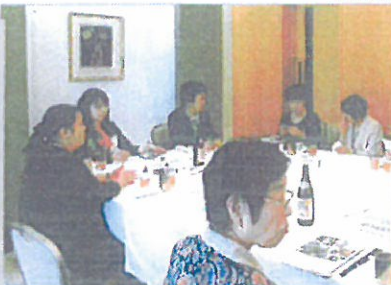
毎回「小倉様」から 手作りの小袋を頂いて 一段と会が和みます。