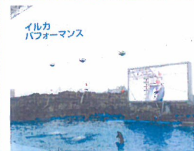
イルカ パフォーマンス