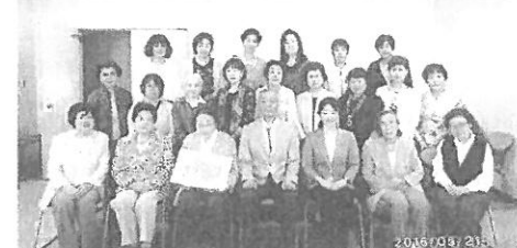
大妻同窓会 43 回総会