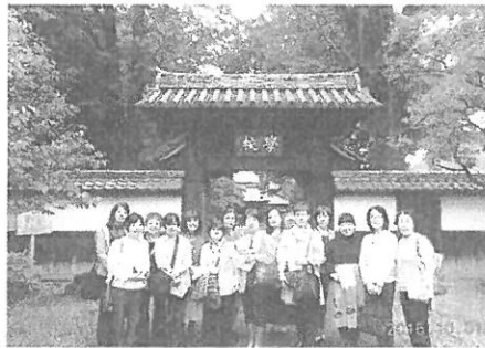
バス旅行 あしかが学校

平成二十八年十月一日(出)、史跡足利学校とあしかがフラワーパークに行きました。お天気に恵まれ、日本遺産に設定された足利学校をゆっくり、ガイドさんに案内されて建物も庭も楽しむことができました。現存する日本最古の学校は貴重な建造物が建ち、国宝や重要文化財指定の