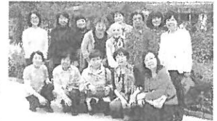
バス旅行 フラワーパーク