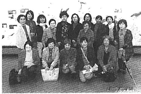
バス旅行 鳥の博物館にて