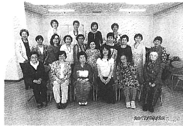
大妻同窓会 44 回総会