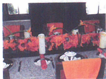
世界のクリスマス・山手西洋館