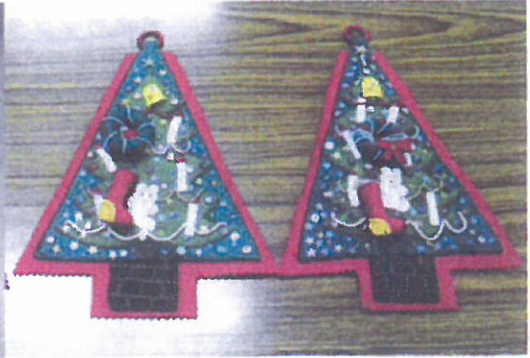
クリスマスツリー作り