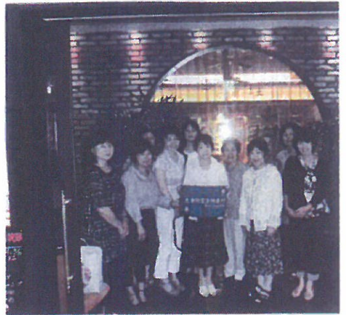
煌蘭にマ 大妻の思い出を語る