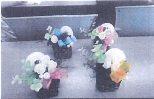
フラワー アレンジメント in 神奈川