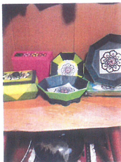
埼玉にて 韓紙工芸