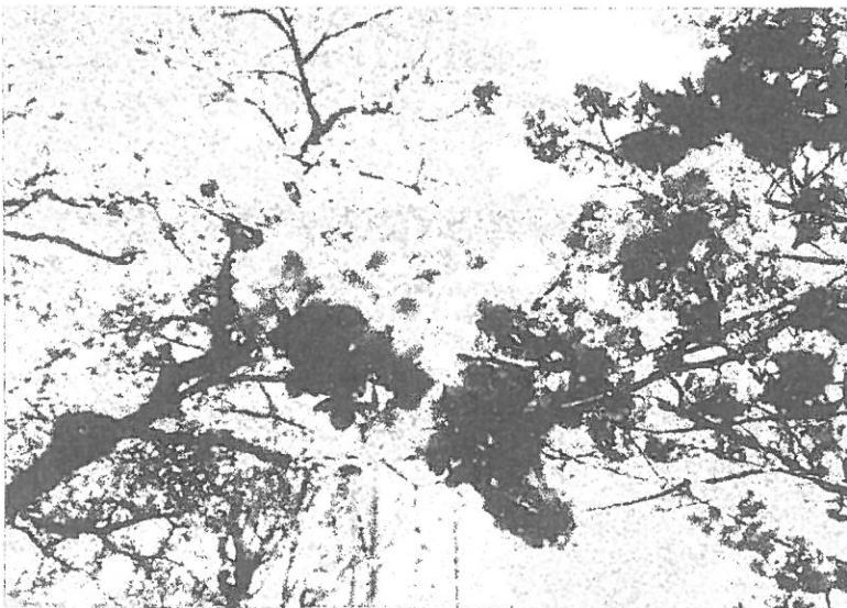
(写真上) 段葛付近にある喫茶店のさくらフェアで出された商品