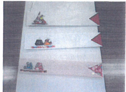
ひな祭りの はし袋