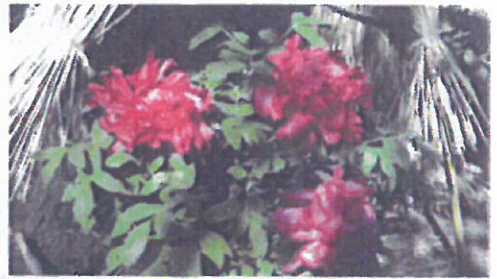
↓ 鎌倉八幡宮 神苑ぼたん庭園