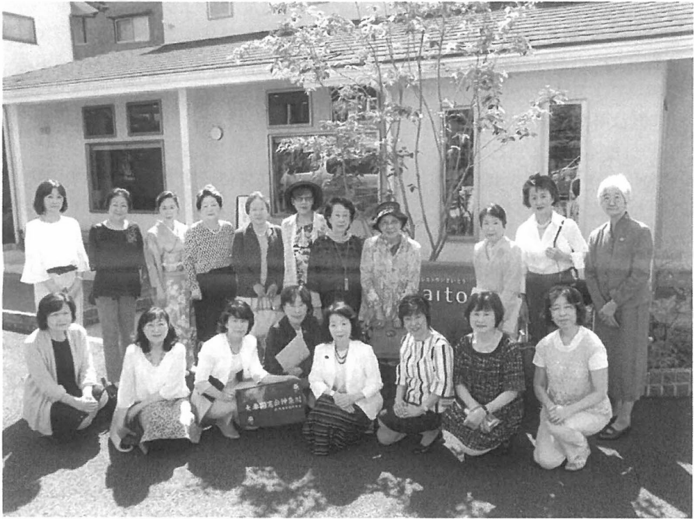
△大妻同窓会神奈川定期総会(2017年5月20日)の集合写真 ▽野菜レストランさいとう