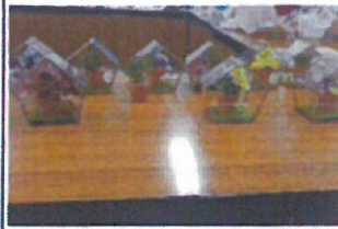
ガラスケースを使用した作品作り