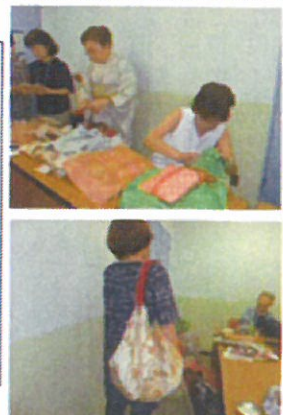
カーテン生地で作る小物