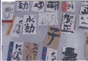
筆で書く年賀状づくり