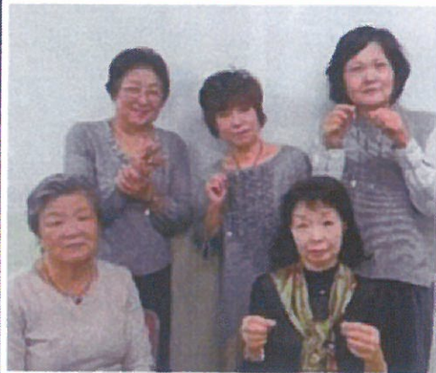
ビーズ利用のネットクレスづくり