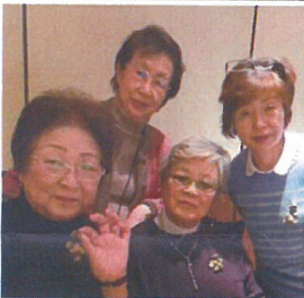
どんぐりブローチづくり