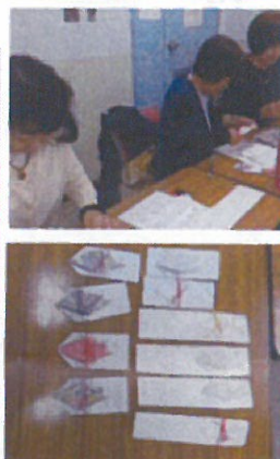
鶴の箸袋・ポチ袋づくり