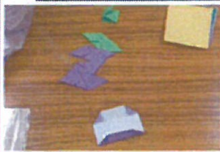
おりがみで作るルービックキューブ