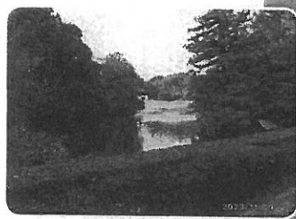
旅行 川村記念美術館庭園写真