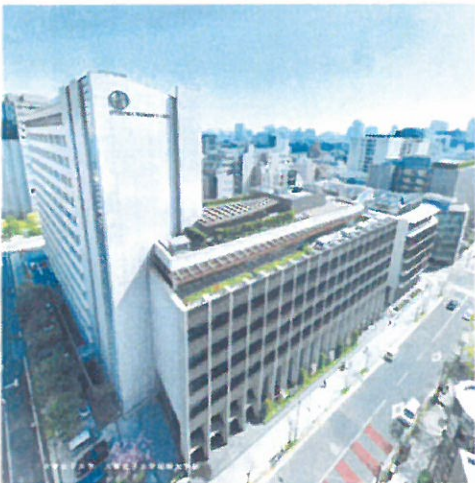
OTSUMA CHIYODA CAMPUS GUIDE MAP 参照 大妻さくらフェスティバルパンフレット 参照

井上先生には一日大変お世話になりました、ありがとうございました。また参加くださいました会員の皆様お疲れさまでした。(小河原芳枝)