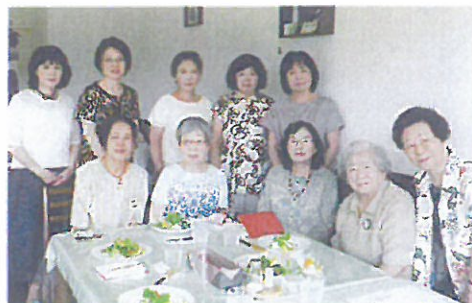
伊那での聞きとり調査にご協力下さった同窓会の皆様

また、当時家政学部は一クラス七十名位だった。実験実習は半数ずつの授業で、食品学だったと思うが、バスで群馬県のコンニャク製造の家内工業見学とか麩の製造工場とか見て回り濃密な授業が行われたと思います。小石川グランドでの体育祭、校友会主催の大妻祭など懸命に取り組んだ思い出は尽きません。五十年以上前に「大学に進み学ぶことは、女子でもいつか社会の役に立つ。いくなら四年に」と両親に進めてもらい、その言葉どおりに大妻に学ばせて頂いたお蔭で「恥を知れ」が自分の心の柱となり誇りとなり今日に。あの十八才の素直な心が、すべての原点にあったと思っている。